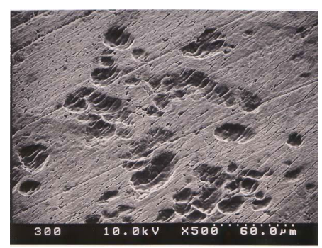
図 3 象牙切片上の吸収窩 (Pit) SEM 写真