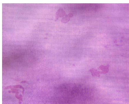
図 2 象牙切片上の吸収窩 (Pit) HE 染色