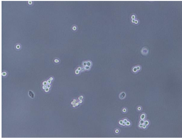
図 1. 播種直後の細胞