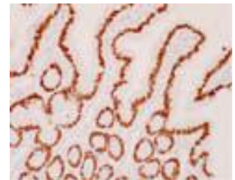
Rat Intestine Epithelial cell paraffin section