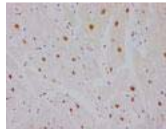
Human Heart Myocardium paraffin section