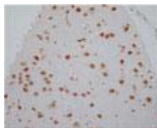
Rat Cerebrum Nerve cell paraffin section