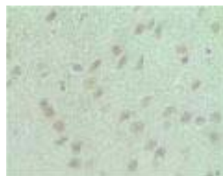
Rat Cerebrum Nerve cell paraffin section