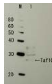
図 1 抗 Taf10p 抗体を用いたウエスタンブロット法による Taf10p 抗原の検出 レーン 1、出芽酵母細胞抽出液 抗血清は、5,000 倍希：して使用