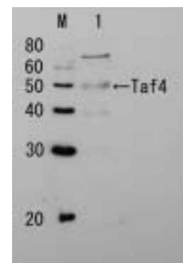
図 1 Taf4p 体を用いたウエスタンブロット法による Taf4p 原の検出 レーン 1、出芽酵母細胞抽出液 血清は、5,000 倍希釈して使用