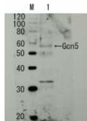
図 1 Gcn5p 体を用いたウエスタンブロット法による Gcn5p 原の検出 レーン 1、出芽酵母細胞抽出液 血清は、5,000 倍希釈して使用